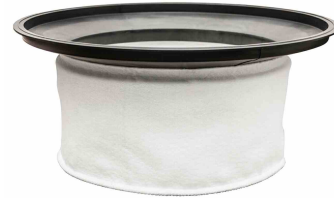
Main Cloth Filter - Included