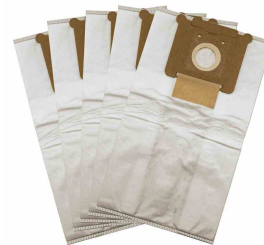
A package of 5 synthetic recovery bags is included (Part No. 212501)