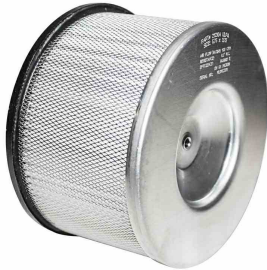
ULPA Filter for CR-1 ULPA - Included

Bitte beachten Sie, dass die Spezifikationen ohne vorherige Ankündigung geändert werden können