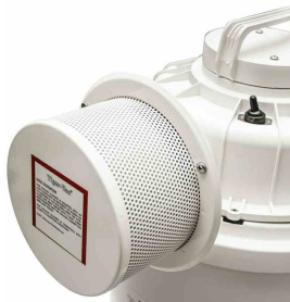
#214860 HEPA/ULPA Filter Protector/Housing Kit - Available