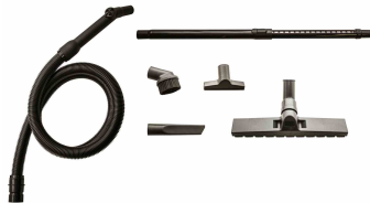
A complete tool kit is included (Part No. 323495)