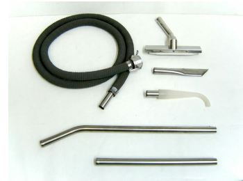
#323604 - Ø1.25" (Ø32 mm) Autoclavable tools and accessories (Kit #3) - Optional