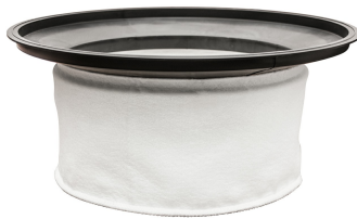
Main Cloth Filter - Included