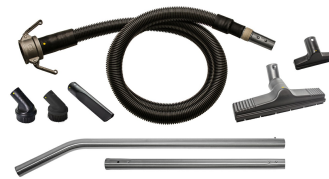
# 323602 - Ø1.25" (Ø32 mm) ESD safe tools and accessories (Kit #2) - Optional