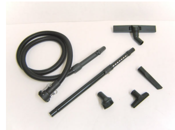
# 323600 - Ø1.25" (Ø32 mm) Standard Tools and Accessories (Kit #1) - Optional