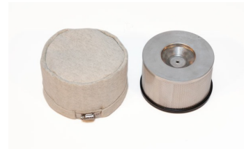
HEPA Filter with Safety Filter - Included