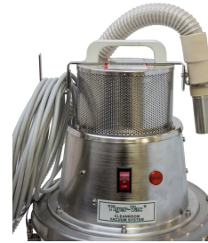
Stainless steel holding bracket - Optional