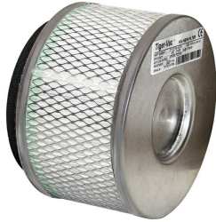
HEPA Filter - Optional