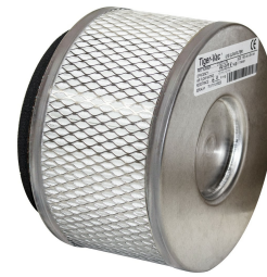
ULPA Filter - Included