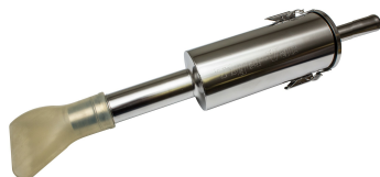
Needle Trap - Optional