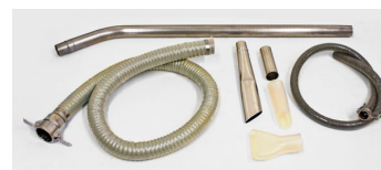
CWR-10 (PHARMA) Tools and Accessories - Included