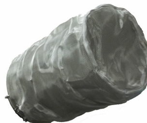
Stainless Steel Mesh Filter - Included