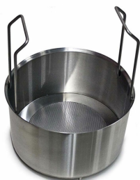
CWR-10 (PHARMA) Sieve Basket - Included

Bitte beachten Sie, dass die Spezifikationen ohne vorherige Ankündigung geändert werden können