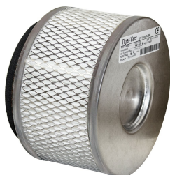
ULPA Filter - Included