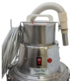
Stainless steel holding bracket - Optional