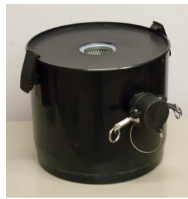
Safe containment canister - Included