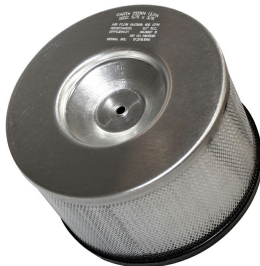
ULPA filter for MV-1CR (HH-CC) - individually laser tested

Bitte beachten Sie, dass die Spezifikationen ohne vorherige Ankündigung geändert werden können