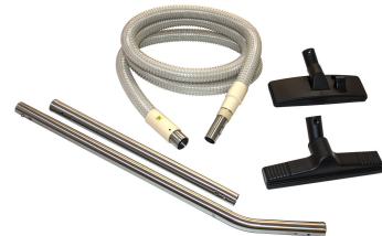
MV-1CR Tools and Accessories - Optional