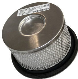
ULPA filter for MV-1CR (HH) - individually laser tested

Bitte beachten Sie, dass die Spezifikationen ohne vorherige Ankündigung geändert werden können